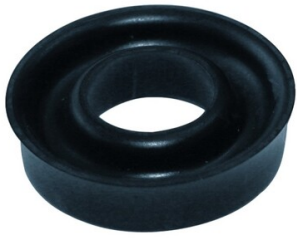
Merkmale Serie: NU